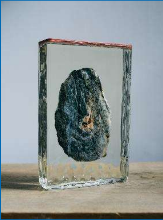
Preparaat van een stoflong. Collectie Universiteitsmuseum Groningen, foto uit de serie 'Toen de Mijnen verdwenen' © Wouter Zaalberg