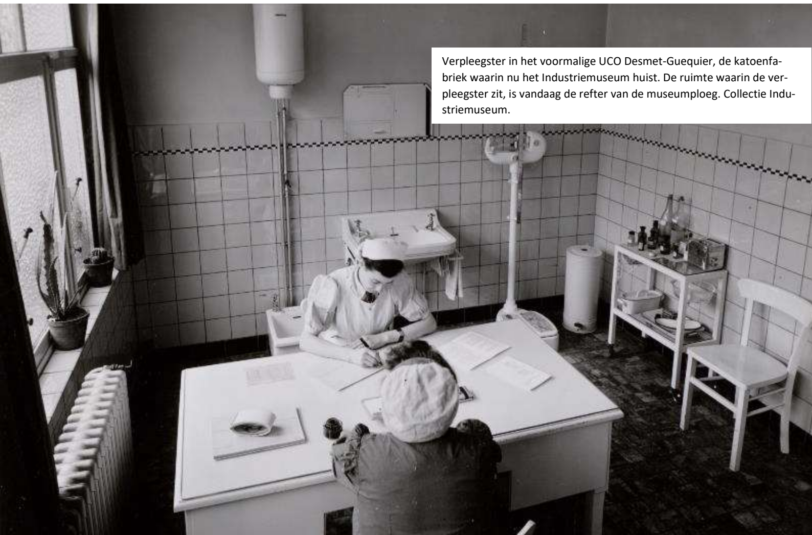
Verpleegster in het voormalige UCO Desmet-Guequier, de katoenfabriek waarin nu het Industriemuseum huist. De ruimte waarin de verpleegster zit, is vandaag de refter van de museumploeg.

De expo BURN wordt belevend en interactief, zet het thema welzijn en veiligheid extra op de kaart en nodigt uit tot reflectie en debat.